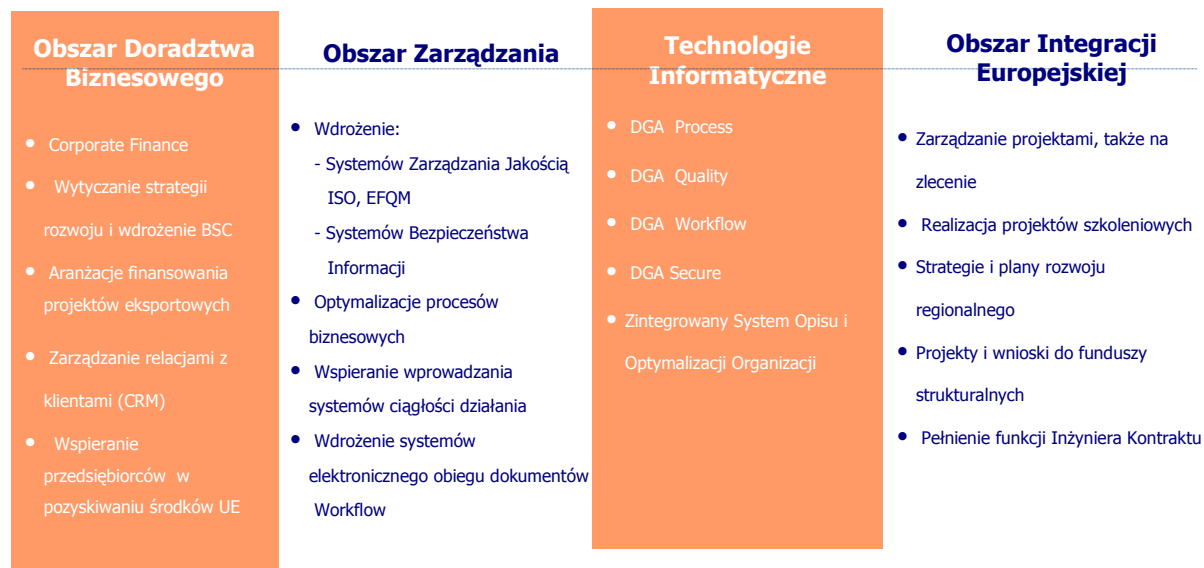
Diagram nr 1: Produkty doradcze DGA S.A.